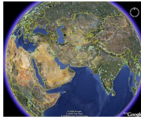
Google Earthから GEMS/Waterモニタリングステーションが確認できます。